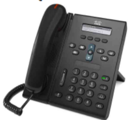
Cisco Unified IP Phone 6921